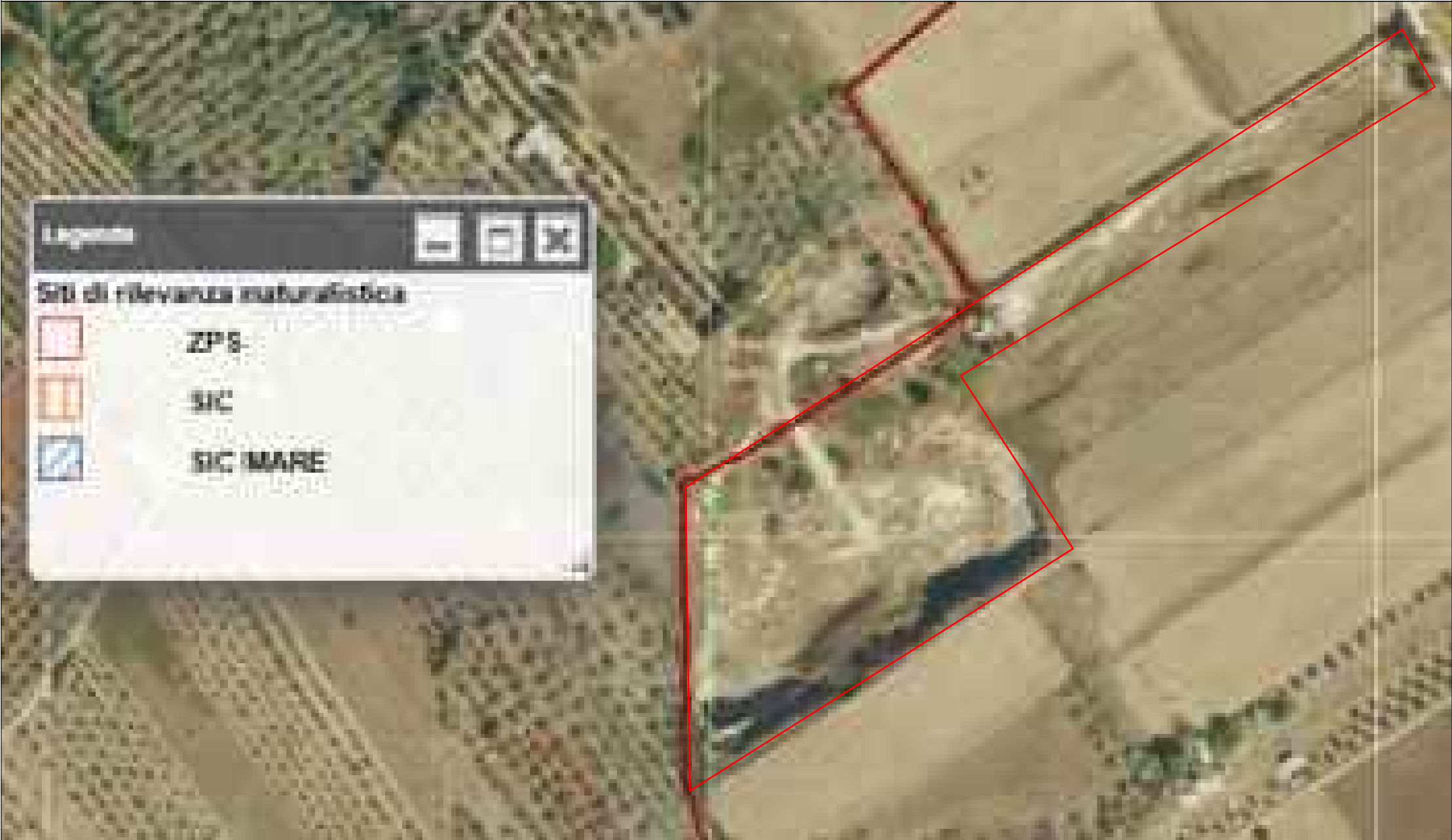
Piano di gestione della Rete Natura 2000